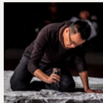
林盟山 © 攝影

1973 年生於臺灣，1998 年畢業於臺北藝術大學美術系，獲學士學位；2017 畢業於臺南藝術大學藝術創作與理論研究所博士班，獲博士學位。創作媒介主要透過錄影、計畫型身體行動、書寫為介面，主要關注議題：身體、社會性、歷史域、資本與生命、東亞諸眾，現生活及工作於臺北。